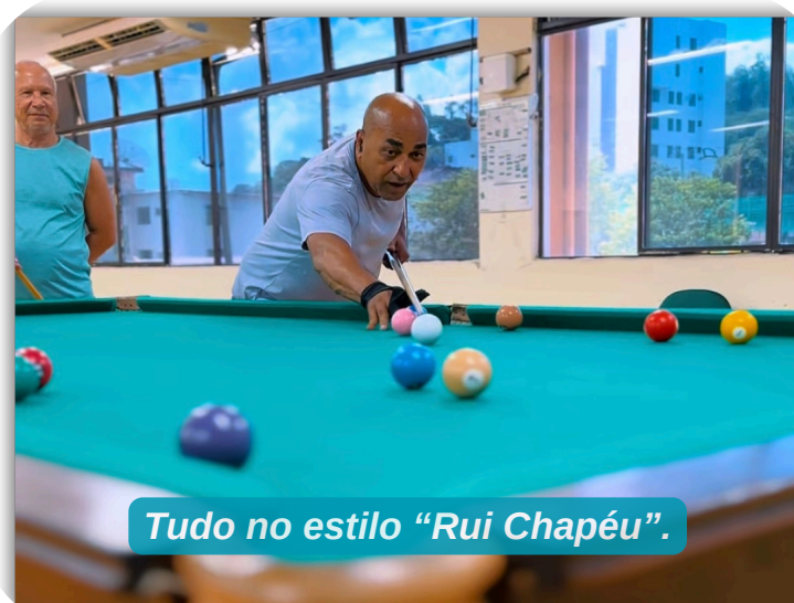
Tudo no estilo "Rui Chapéu".