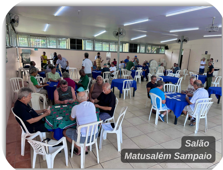
Salão Matusalém Sampaio