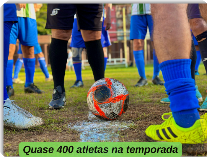
Quase 400 atletas na temporada