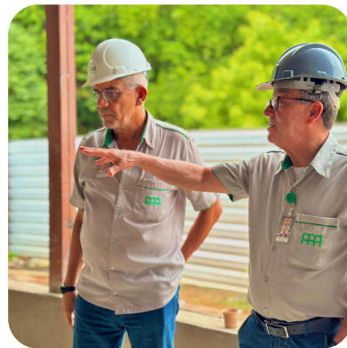
Melhorias no Clube dos Pioneiros