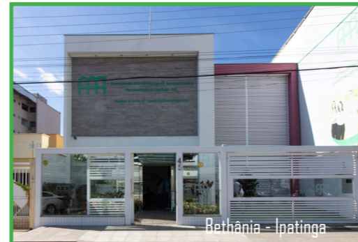
Bethânia - Ipatinga