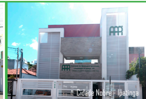
Cidade Nobre - Ipatinga