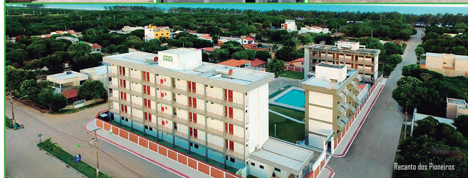
Recanto dos Pioneiros