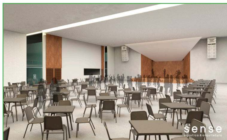
Novo Salão de Eventos