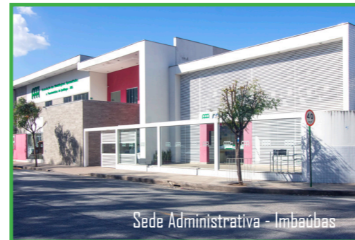
Sede Administrativa - Imbaúbas

Uma outra Subsede da AAPI, já aprovada pela diretoria, será inaugurada em Timóteo com previsão de iniciar o atendimento no segundo semestre.