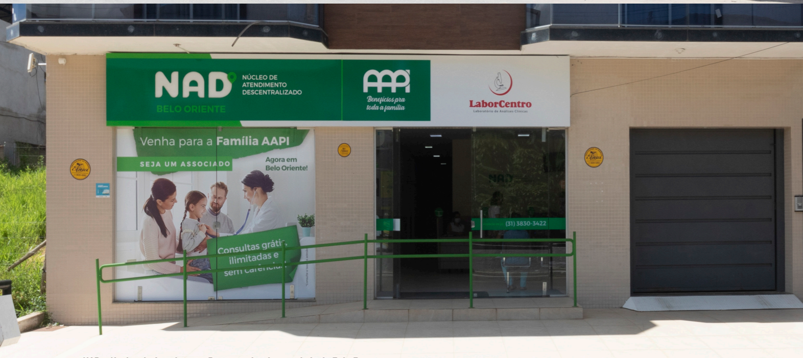
NAD - Núcleo de Atendimento Descentralizado na cidade de Belo Oriente.