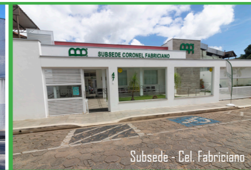
Subsede - Cel. Fabriciano