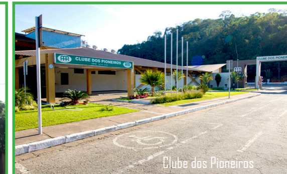
Clube dos Pioneiros