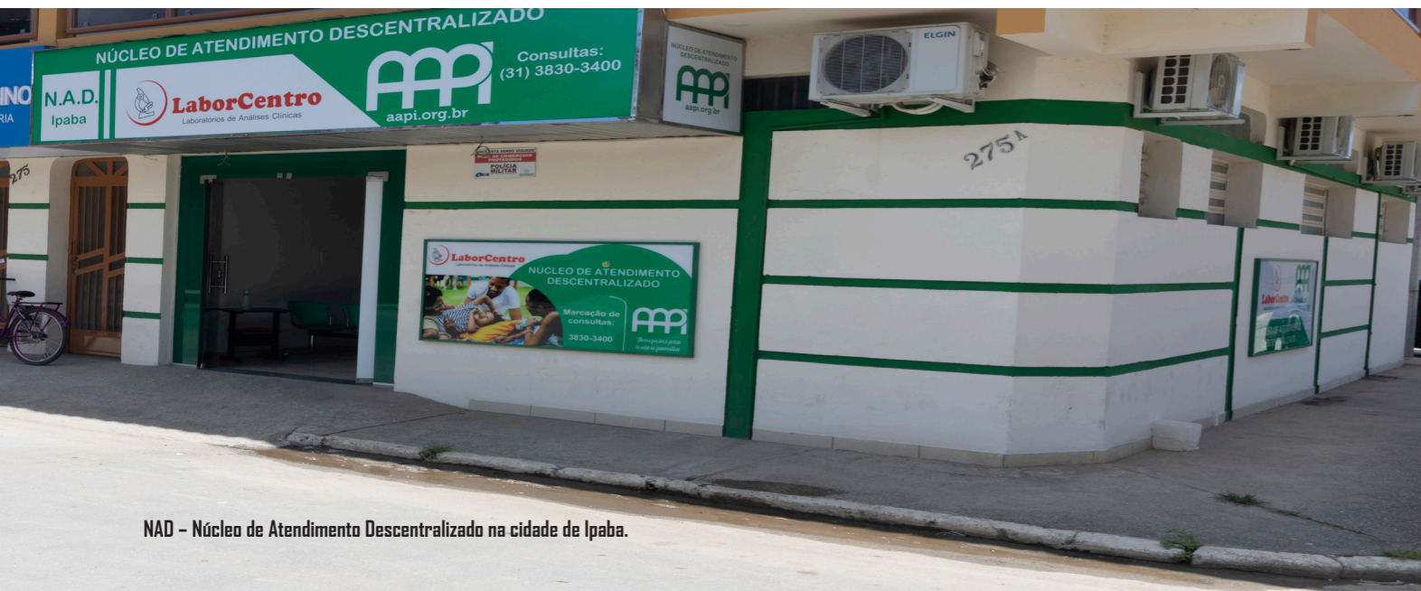
NAD - Núcleo de Atendimento Descentralizado na cidade de Ipaba.