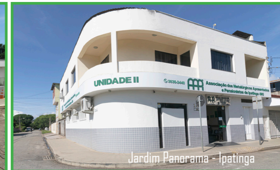
Jardim Panorama - Ipatinga